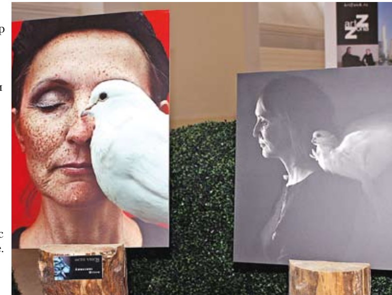
Проект «Земляничное дерево»

Среди событий Эко-недели была выставка «Зелёный остров» живописных и фоторабот участников конкурса ArtPreview-2013.