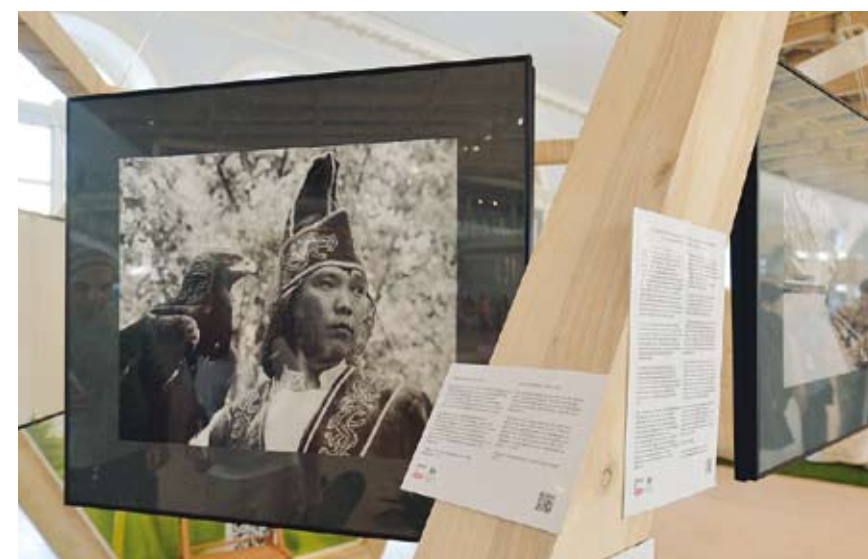
Выставка Мэттью Вебба «Низкоуглеродный» стиль жизни»

Британский фотограф и дипломат Мэттью Вебб представил свой проект «Путешествие в «низкоуглеродный» стиль жизни» – выставку фотографий, созданных им во время путешествия по России и странам СНГ. От марафона через Байкал (чтобы привлечь внимание к проблемам сохранения водных