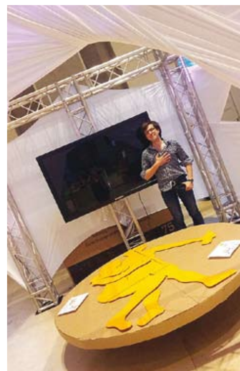
Особой Арт-объект "Quorum"

объектов паблик арт на тему экологии города. Среди посетителей нашлось довольно большое количество ценителей подобного симбиоза культуры и природы, поэтому половина объектов, представленных на презентации, были тут же проданы.