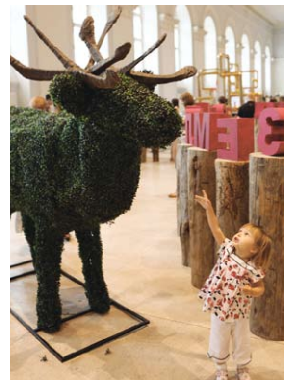
Проект «Земляничное дерево»