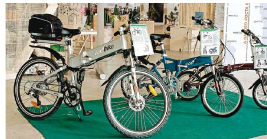
Особой популярностью пользовались экобайки