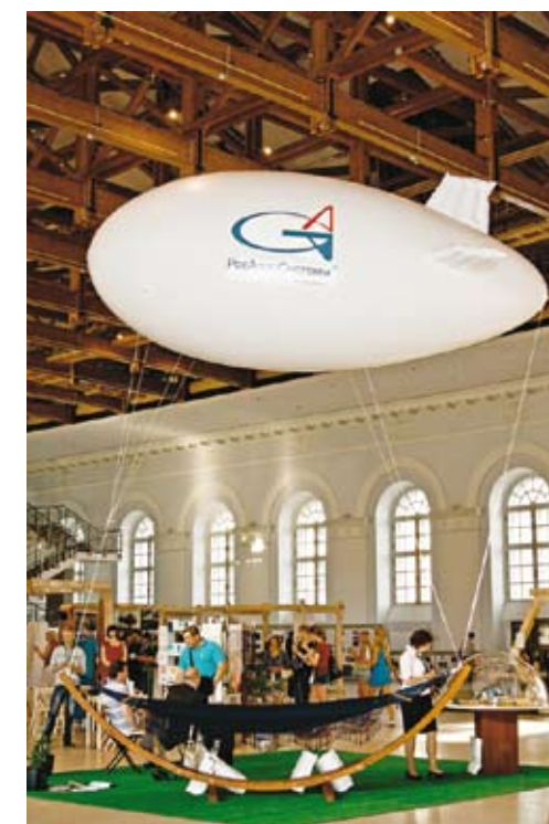
Под сводами «Манежа» парил дирижабль «Авгурь»

мых проблем, но и разделяет с обществом ответственность за социальную несправедливость, экономическое неравенство и экологические проблемы. При этом ведущие экологические организации проявляют обеспокоенность появлением и активным внедрением в рамках корпоративной социальной ответственности (КСО) такого явления, как «green washing» – использование несущественных экологических акций для создания видимости экологической ответственности, – призванного «оттень» экологически деструктивную деятельность реализуемых компанией бизнес-проектов. Как более мягкую форму подобных «эко-спекуляций», можно рассматривать мизерную экологическую деятельность – видимую экологическую активность, не соответствующую получаемому компанией пиару. В этих случаях затраты на сопроводительный пиар многократно превышают усилия, потраченные на сами экологические акции. Подобные подходы обесценивают понятие экологической составляющей