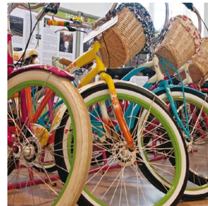
Стильные велосипеды Electra

Подводя итог, можно сказать следующее. Об экологической обстановке в крупных городах, грозящей настоящей эко-катастрофой, написано столько, что повторяться не имеет смысла. Главное, что показала Эко-неделя в Манеже, – сколько всего сделано и делается для того, чтобы жители могли чувствовать больше уверенности в будущем своих городов. Производятся экологические продукты питания и средства по уходу, шьётся одежда из натуральных тканей, выпускаются экомобили и тренажёры для здорового образа жизни – это и многое другое можно было увидеть на Российской экологической неделе.