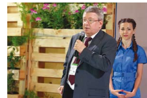
Александр Торшин открыл Российскую эко-неделю

дипломатического корпуса и крупнейших международных компаний. С приветственным словом от Федерального собрания выступил Первый заместитель председателя Совета Федерации А.П.Торшин.