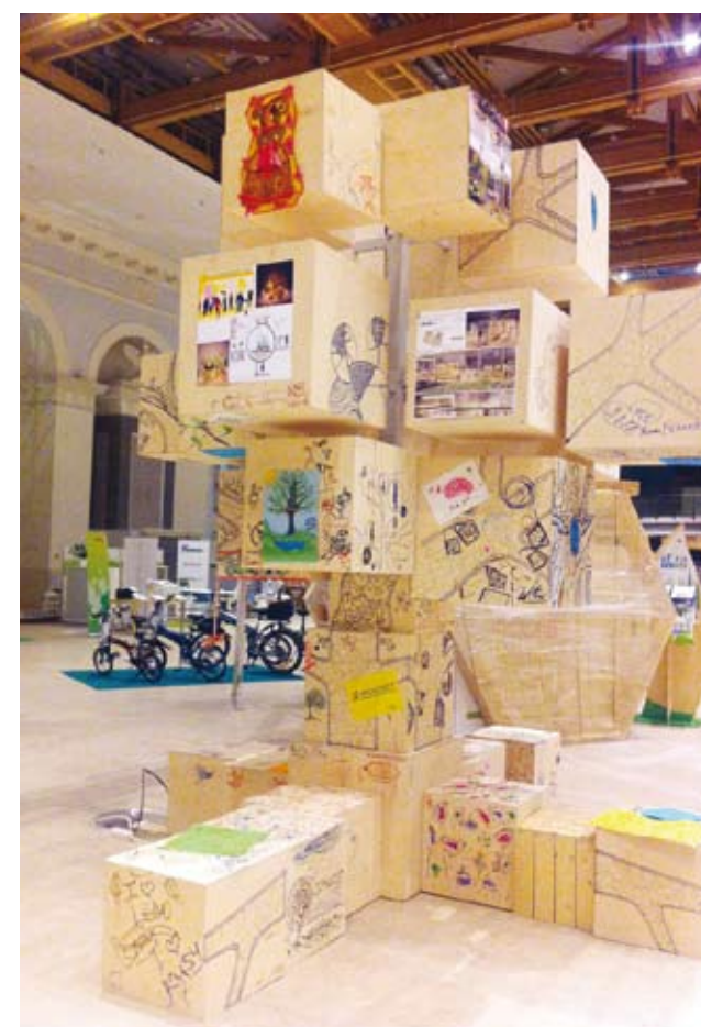
Дерево 8 бит