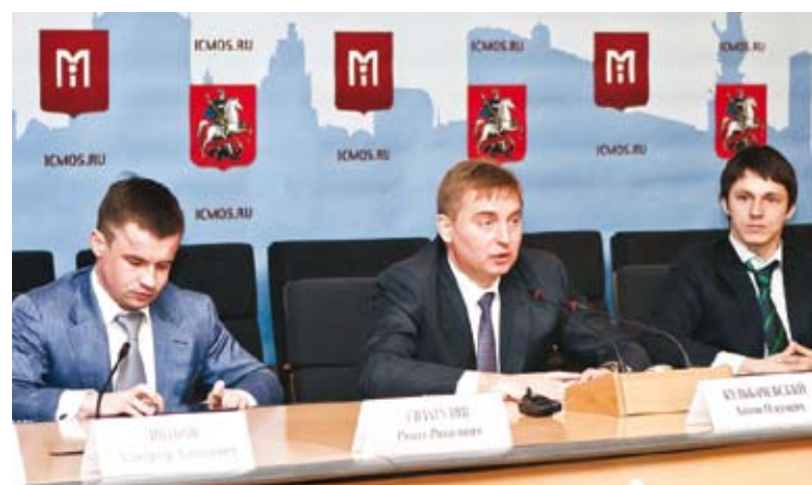
Пресс-конференция в пресс-центре Марины Москвы