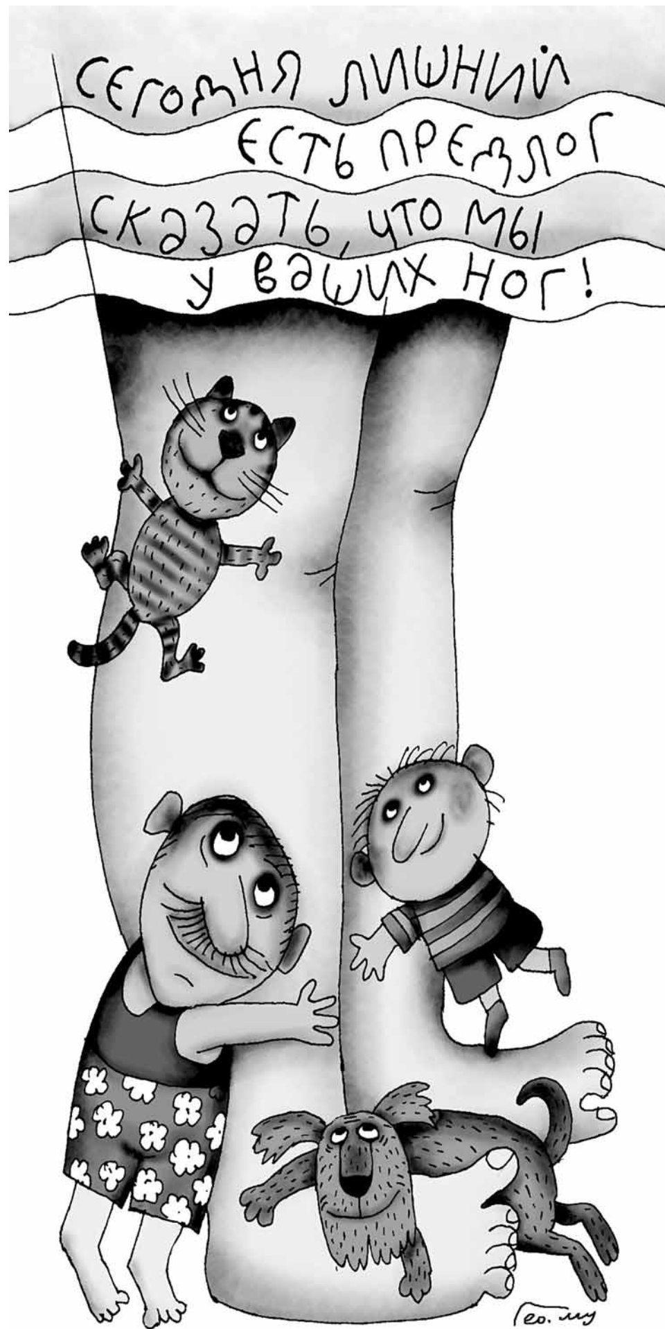
Рисунок Георгия Мурышкина.