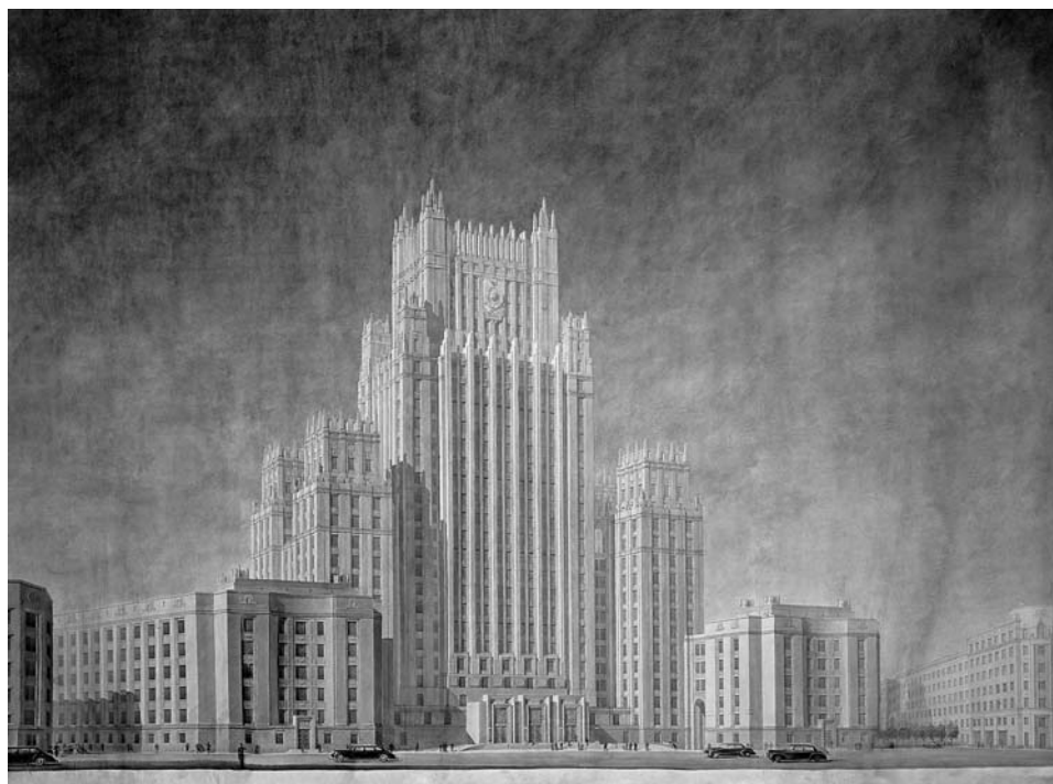
Проект здания МИД на Смоленской пл. Архитектор М.А. Минкус.

В парадной анфиладе главного здания Государственного музея архитектуры им. А.В. Щусева 28 декабря торжественно при огромном стечении архитекторов открылась юбилейная выставка, посвященная 80-летию Моспроекта, одной из крупнейших проектных организаций Москвы.