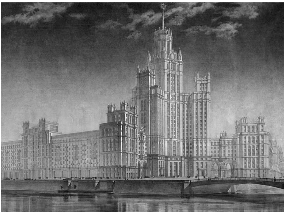
Проект высотного дома на Котельнической наб. Архитектор Д.Н. Чечулин.