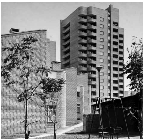
Комплекс жилых и общественных зданий на улицах Б. и М. Каменщики.