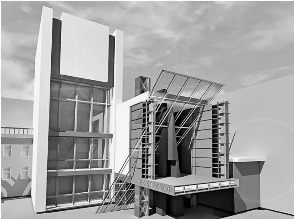
Проект К.Киселева «EuroDOM».

В конце марта в ресторане Центрального дома архитектора стартовал весенний этап конкурса «Творческая Москва», проводимый при инициативе информантства СА «Архитектор». На открытии конкурса было решено создать новый архитектурный клуб, собрания которого будут проходить каждый вторник в ресторане «Архитектор».