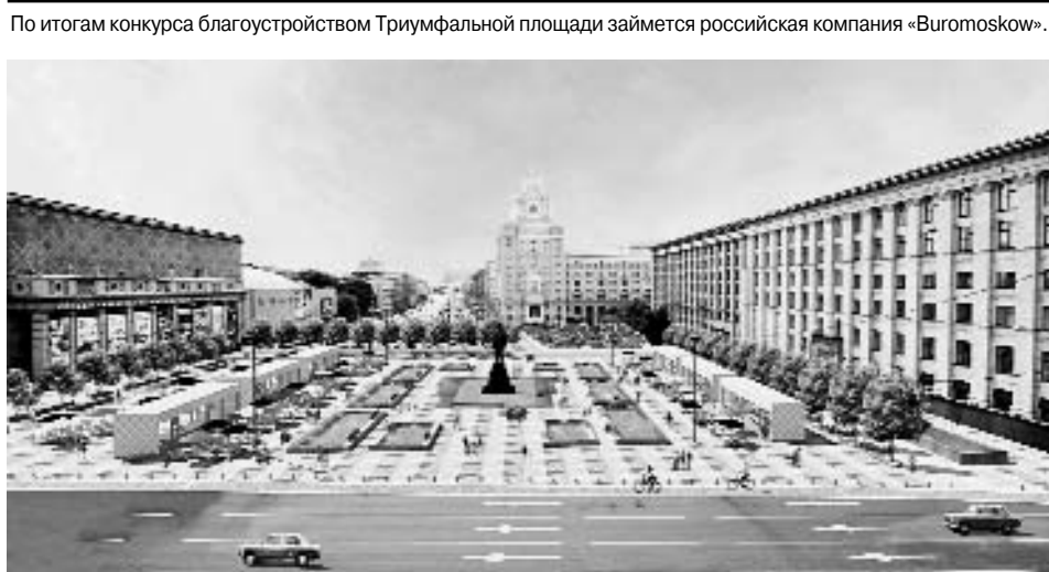
По итогам конкурса благоустройством Триумфальной площади займется российская компания «BuroMoscow».