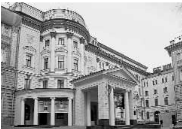
Реставрация здания Московской государственной консерватории им. П.И. Чайковского.