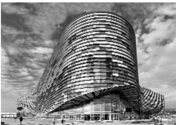
Ледовый дворец спорта для фигурного катания и соревнований по шорт-треку на 12 тыс. зрителей. Имеретинская низменность (Сочи).